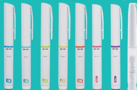
SP笔式注射器组合件