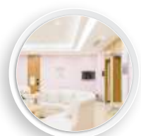
医疗卫生 服务机构